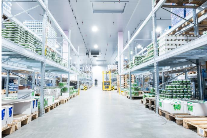
Bild 1: WMS NOW beinhaltet neben einem Software-Update von SNC Logistics auch alle standardisierten Kernprozesse der Lagerlogistik.